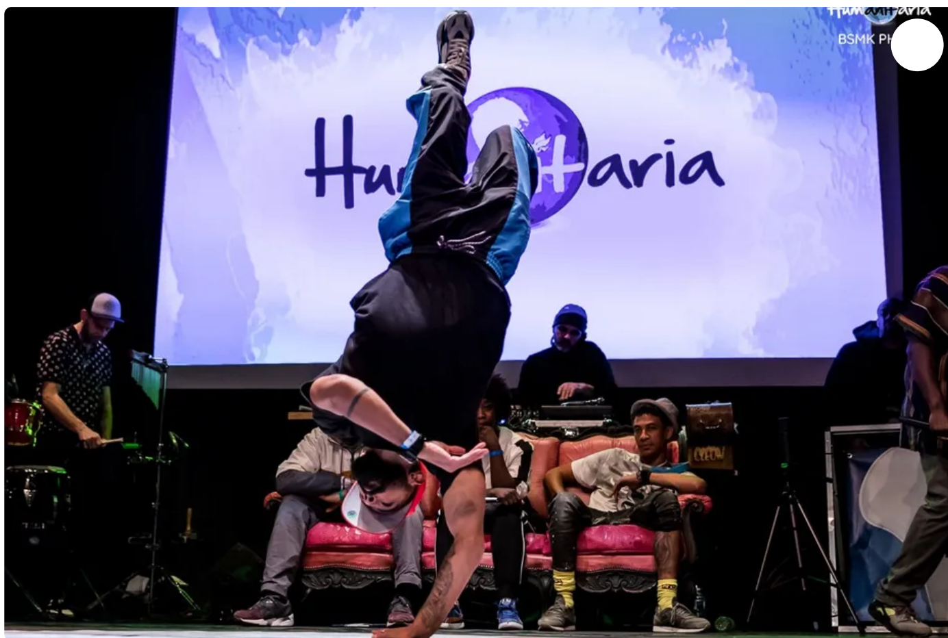
Le breakdance fera partie des activités proposés à Massy ce week-end